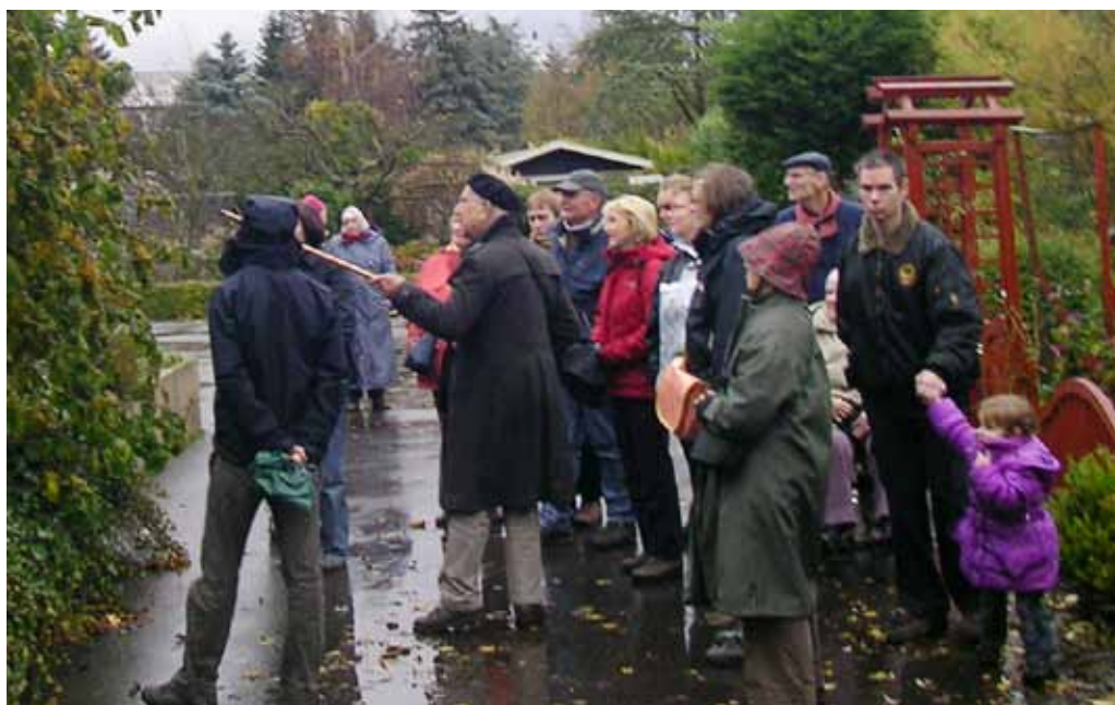
Vervols van pagina 10

eind van de winter boven in de kroon te eindigen.