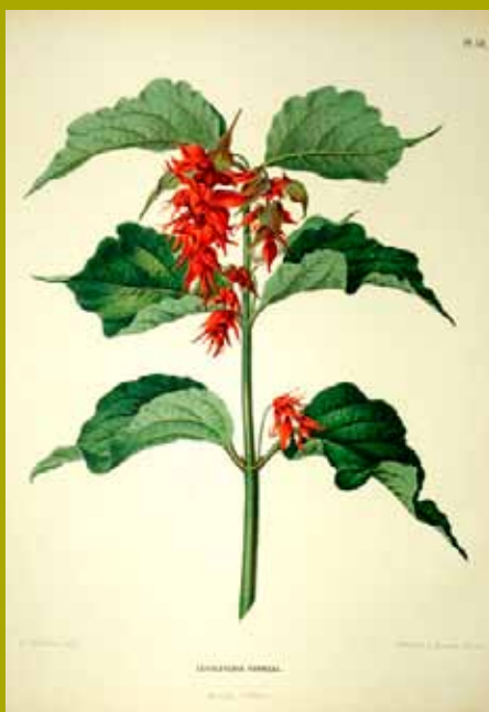
GROOTMOEDERS OORBELLEN ( LEYCESTERIA FORMOSA)