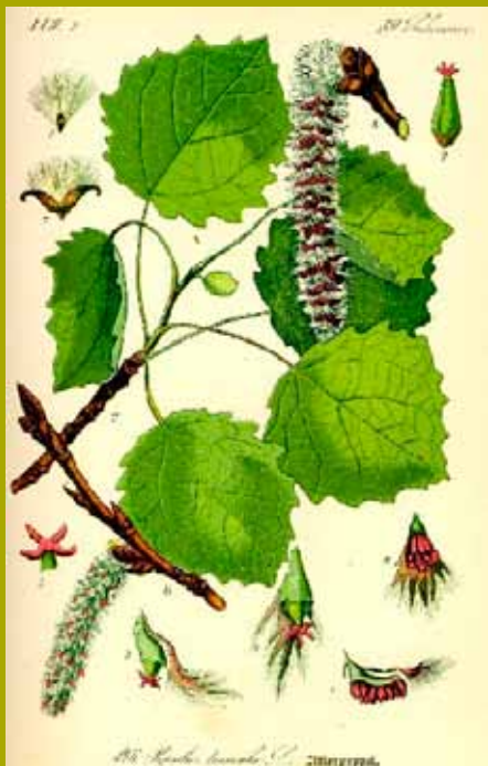
RATELPOPULIER, POPULUS TREMULA L.

Op naar een volgende pionier; dat wil zeggen een boomsoort die de weg vrij maakt voor andere boomsoorten. Ditmaal de zwarte els; de boom die samen met de gewone es het karakter van de boomsingels bepaalt. In 1960 heeft de Gemeente Utrecht gezorgd voor de aanplant van een boomsingel rond het complex, bestaande uit snelgroeiende zwarte els, gewone es en grauwe abeel. Elzen leven in symbiose met schimmels die voor de binding van stikstof uit de lucht zorgen. Deze levensgemeenschap bevindt zich in knolletjes aan de wortels. En dat is een voordeel in de van nature stikstofarme bodems van de zware natte klei- en veengronden. Daarvan profiteert hijzelf en vervolgens vele anderen. We bekijken de minuscule vrouwelijke en grote mannelijke katjes die al te zien zijn, maar pas over een paar maanden zullen bloeien (februari – maart). Het zijn dus eenhuizige planten met zowel mannelijke als vrouwelijke bloemen in huis. Om zelfbestuiving te voorkomen bloeien eerst de mannelijke bloemen en vervolgens de vrouwelijke. Sijsjes zijn liefhebber van de kleine zaadjes die ze uit de elzenpropjes weten te peuteren. Ze beginnen in de herfst beneden om aan het