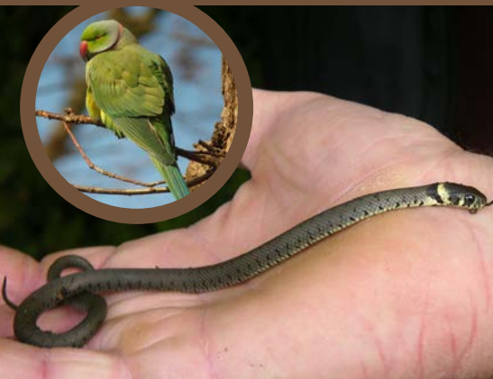
HALSBANDPARKIET (BOVEN) EN BABY RINGSLANG