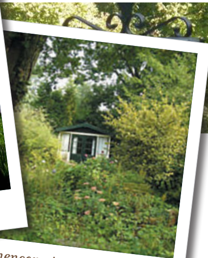
Siertuinencomplex 'Ons buiten'

De gemeente en de besturen van de parken bespreken in dat overleg allerlei actuele zaken. De komende jaren zal onder andere over het nieuwe pachtcontract gesproken worden. In 2014 loopt het oude af. Ook hier geldt weer dat je als bestuur