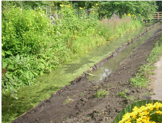
DE OEVER LANGS DE PERENLAAN

Om wat te bereiken moet je eerst pijn lijden. Dat hebben we wel gemerkt bij de aanleg van de ecologische oever aan de Perenlaan. Daar had de aannemer weinig oog voor de egelboterbloem en zwanenbloem en al die andere veenweidesoorten die hier groeiden. Best uniek, want hier was nooit grond op de schop gegaan. Op de valreep heb ik de beste stukken met hulp van de graver opzij weten te zetten. Er zaten er jonge ringslangen en watersalamanders tussen de kluiten die hij uitgroef. Die heb ik op een veiliger plek losgelaten. De oever was een wens van het waterschap met als doel een betere doorstroming te krijgen. Er wordt voor de winter ingezaaid met soorten van nat hooiland, zoals dotterbloem, pinksterbloem en koekoeksbloem. Wel even geduld, want het duurt wel 5 jaar voor er bloemrijk hooiland te zien is.