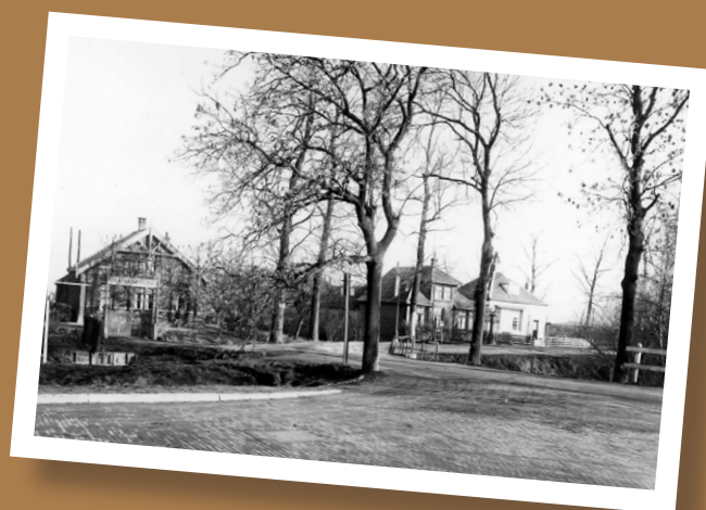
Foto boven: De beheerderswoning (geheel links) en toegang tot de volkstuinen van de Volksbond tegen drankmisbruik in 1932. De beheerderswoning stond op de plek van de huidige rotonde tussen Blauwkapelseweg en Eykmanlaan. Geheel rechts het tolhuis en de Ezelsdijk. Tussen de Blauwkapelseweg en de huidige Jordanlaan werd tol geheven. Het gebied achter de Blauwkapelseweg (inclusief het oude Tuindorp) behoorde tot 1954 tot de Gemeente Maartensdijk.