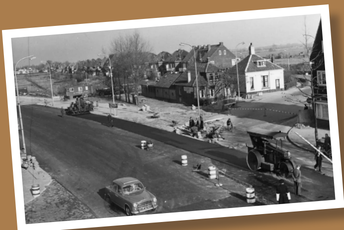
Foto onder: De situatie uit 1932 is tegenwoordig onherkenbaar door de bouw van Tuindorp Oost en de aanleg van de Kardinaal de Jongweg. Deze foto uit 1962 biedt, om een beeld te vormen, meer houvast. Op de foto de aanleg van de rotonde tussen Blauwkapelseweg en Eykmanlaan. Geheel rechts het (niet meer in gebruik zijnde) tolhuis dat nog niet was afgebroken. Het tolhuis stond tegenover het laatste huis van de Blauwkapelseweg waar nu rijschool Veronica is gevestigd. De huizen aan de Eykmanlaan waren nog niet gebouwd.

IN DE VOLGENDE NIEUWSBRIEF MEER OVER HET EERSTE COMPLEX VAN ATV DE PIONIEREN AAN DE EZELSDIJK.