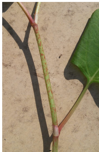
JE HERKENT DE JAPANSE DUIZENDKNOOP AAN DE RODE STREEPJES OP DE STENGEL