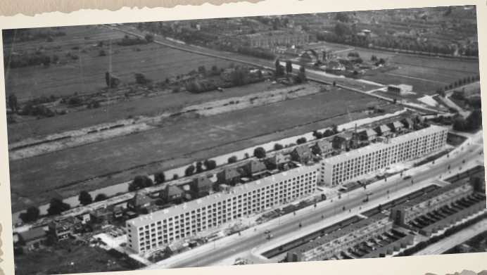
DE EZELSDIJK IN 1960 MET HET INMIDDELS ONTRUIMDE COMPLEX VAN ATV DE PIONIERS (DE LICHTE STROOK). OP DE VOORGROND DE FLATS AAN DE EYKMANLAAN EN DE HUIZEN AAN DE JORDANLAAN. RECHTS HET RIOOLGEMAAL AAN DE EZELSDIJK (THANS VAN ESVELDSTRAAT)