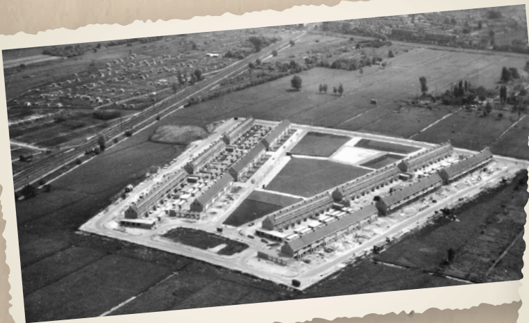
▲ LINKSBOVEN HET NIEUWE COMPLEX VAN ATV DE PIONIERS AAN DE KÖGLAAN IN 1960. OP DE VOORGROND DE HUIZEN AAN HET KOUWERPLANTSOEN IN TUINDORP OOST. RECHTSBOVEN DE EZELSDIJK (THANS HUIZINGALAAN). DE KARDINAAL DE JONGWEG WAS NOG NIET AANGELEGD.