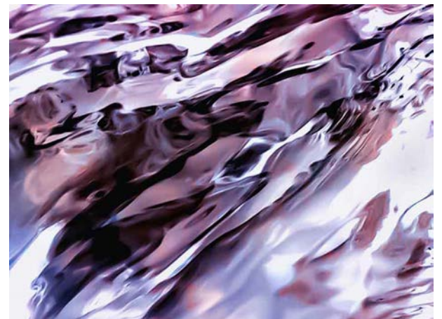
PURPLE RAIN, WATERABSTRACT. FOTOGRAAF: MARIEKE VAN DER DOEF