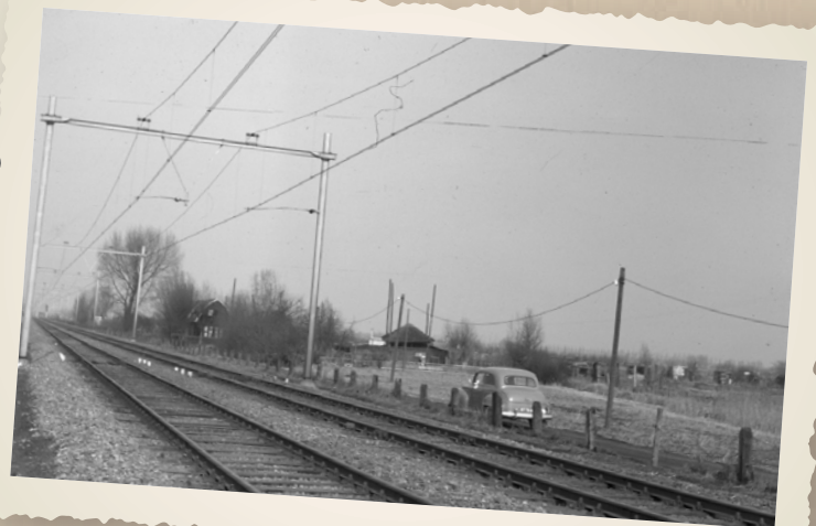
▲ DE KÖGLAAN IN 1962 GEZIEN VANUIT DE RICHTING VAN DE EZELSDIJK (THANS HUIZINGALAAN). OP DE PLAATS VAN HET HUIS OP DE FOTO STAAT NU HOSTEL DE HOEK. OOK OP DEZE FOTO IS DE KARDINAAL DE JONGWEG NOG NIET AANGELEGD. DEZE BREDE EN DRUKKE VERKEERSWEG DOORKRUIST NU HET GEBIED VOOR HET HUIS OP DE FOTO.