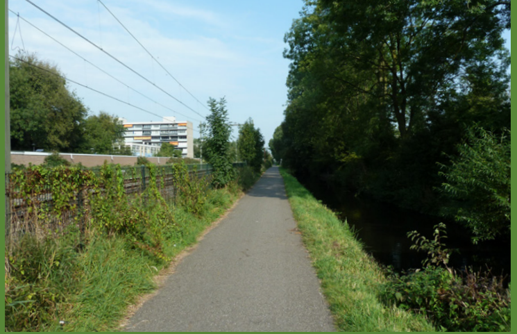
▲ DE KÖGLLAAN IN 2021. OFSCHOON DE OMGEVING DOOR DE BOUW VAN NIEUWE WOONWIJKEN DRASTISCH IS VERANDERD, HEEFT DIT WEGGETJE, TEGENWOORDIG IN GEBRUIK ALS FIETSPAD, ZIJN LANDELIJK KARAKTER REDELIJK BEHOUDEN. AFGEZIEN VAN DE ASFALTERING IS ER WEINIG VERSCHIL MET DE SITUATIE IN 1958.