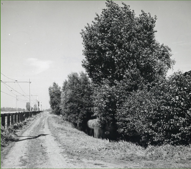
▲ DE KÖGLLAAN IN 1958, EEN NOG NAAMLOOS ZANDWEGGETJE.