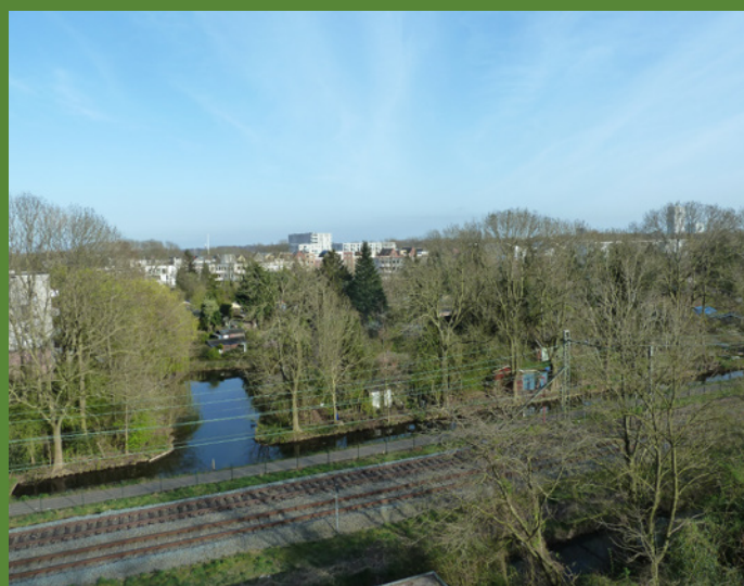
▲ DE SITUATIE IN 2022. LINKS DE HUIZEN AAN DE BISSCHOP ROMEOSTRAAT EN HET WATER WAARIN EEN AANTAL PIONIERS TUINEN VERDWEEN. RECHTS HET TUINENPARK VAN DE PIONIERS.