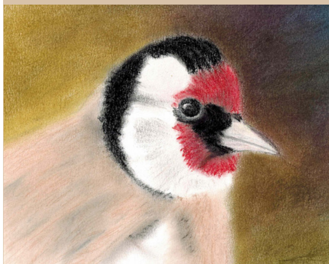
HET (FELLE) GEEL ZIT IN DE VLEUGELS EN ZE NESTELN ZO ONGEVEER ALS DE MEREL, MAAR WAARSCHIJNLIJK WEL HOGER. NIET IN EEN HUISJE DUS.