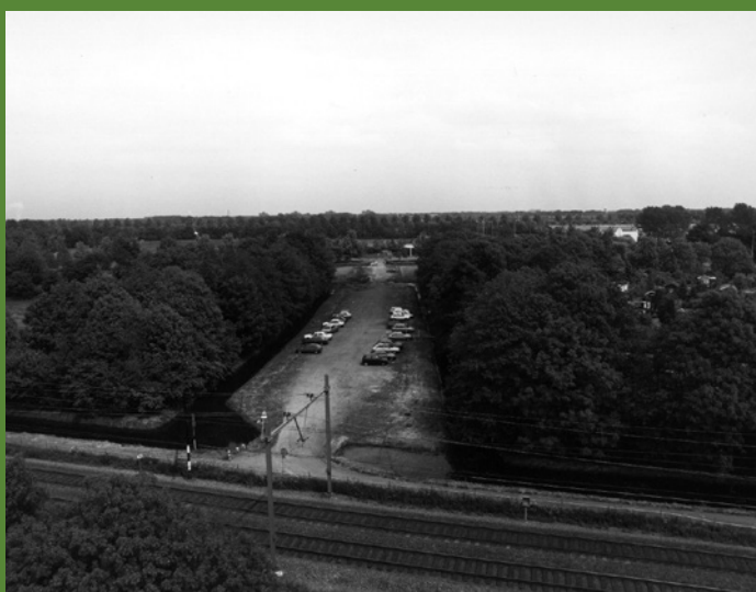
▲ HET PARKEERTERREIN EN ACHTERINGANG VAN DE PIONIERS IN 1988. LINKS EEN SCHOOLTUINENCOMPLEX. RECHTS HET TUINENCOMPLEX VAN DE PIONIERS.